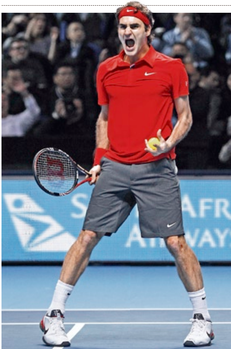
Nach grandioser Leistung zum fünften Mal Tennis-Weltmeister: Roger Federer.

der Initiative fordert, hat die SP nichts zu feiern: Ihre Steuerinitiative scheiterte klar. Bei allen drei Abstimmungen zeigt sich neben dem Röstigraben auch ein deutlicher Graben zwischen Stadt und Land. SEITEN 2-5